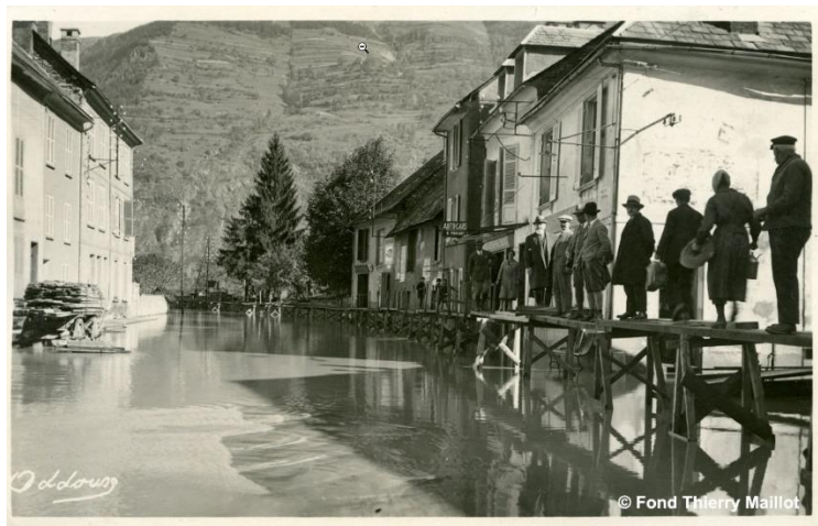
Le Bourg d'Oisans inondé lors d'une crue de la Romanche en 1928

Du fait de la configuration de la plaine et des très faibles pentes, la majeure partie de la plaine est située en zone inondable.